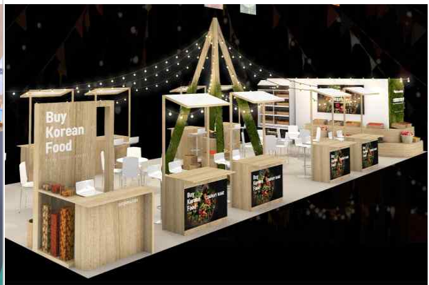
신선 통합조직 홍보관(예시)