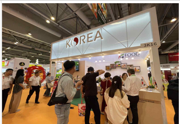
한국관 인포 전경