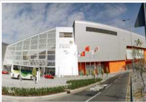
박람회장 외부 모습

* '23년 박람회 개요 : 43개국 700업체 참가 / 70여개국 약 13천명 방문