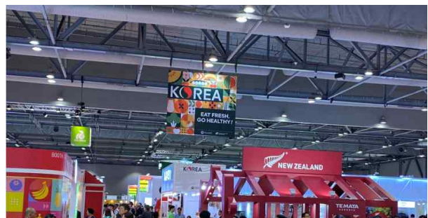
<전시장내 천장배너 홍보 예시>