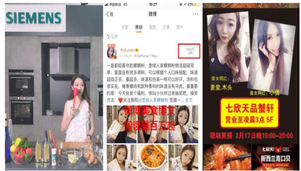
식품관련 왕홍 생중계 예시2