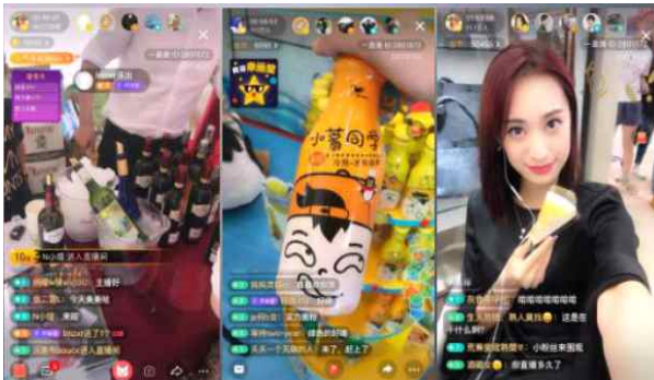
식품관련 왕홍 생중계 예시1