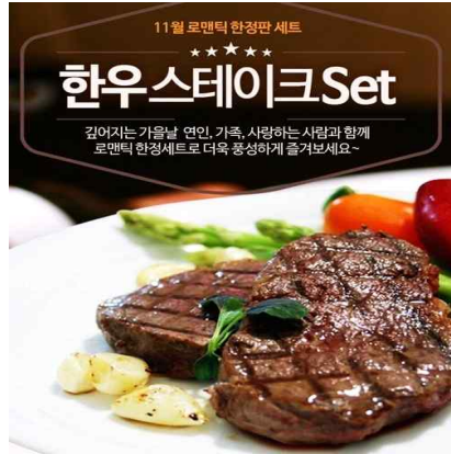
한우 메뉴 디자인 예시2