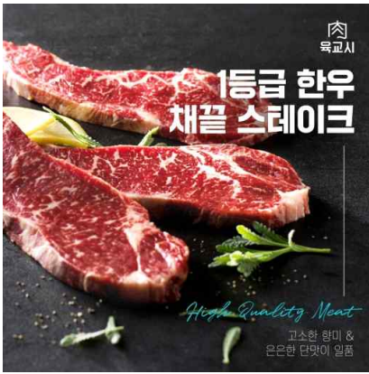
한우 메뉴 디자인 예시1