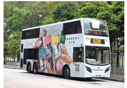
버스 광고 예시