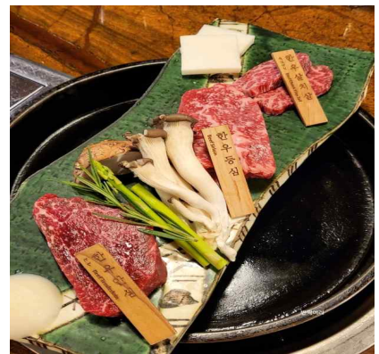
한우 부위별 사진