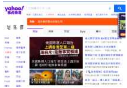
증정품 및 이벤트