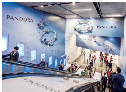
MTR 광고 예시