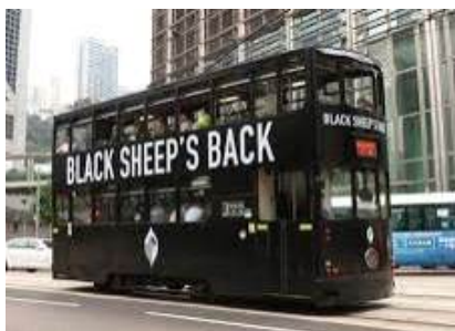
트램 광고 예시