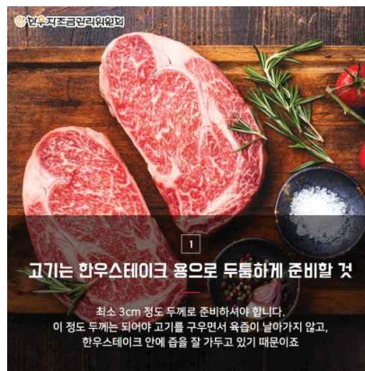
한우 특징 소개