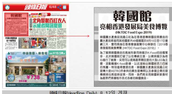
頭條日報(Headline Daily), 8. 12일 게재