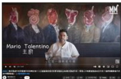
強調產品優點的廚師視頻列子