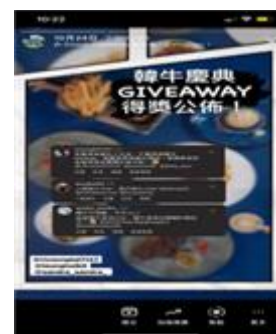
贈送獎品以及活動列子