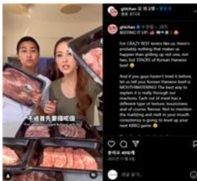
引發對產品的關注的 Instagram KOL視頻列子