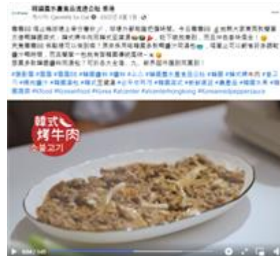
Facebook Post 列子