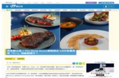
事前媒體宣傳列子