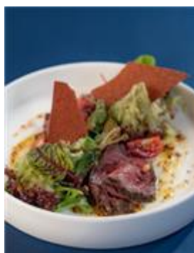
韓牛菜品開發列子